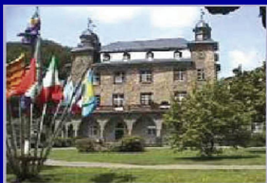
Il Castello di Gimborn, Germania Centro di Formazione Professionale

Via Venier 32 – 62012 Civitanova Marche (MC) entro e non oltre il 31 Agosto di ogni anno.