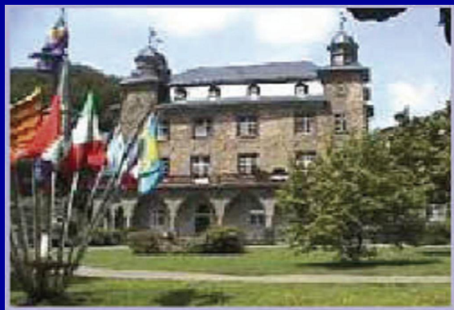
Il Castello di Gimborn, Germania Centro di Formazione Professionale

Via Venier 32 – 62012 Civitanova Marche (MC) entro e non oltre il 31 Agosto di ogni anno.