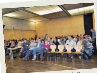
Colonia, il gruppo al Krash-Kurs