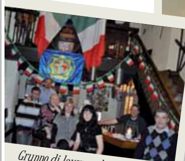
Gruppo di lavoro culinario italiano