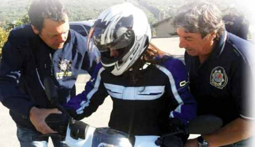
Due istruttori IPA durante la prova pratica