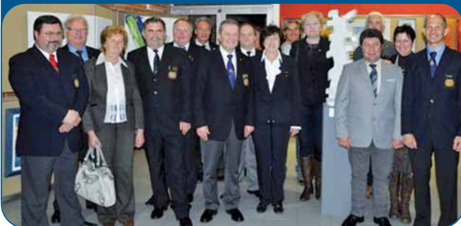
Foto di gruppo con Dirigenti IPA Monfalcone, Klagenfurt, Slovenia, Croazia; artisti italiani, austriaci, sloveni e croati.