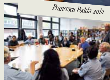
Gruppo di lavoro