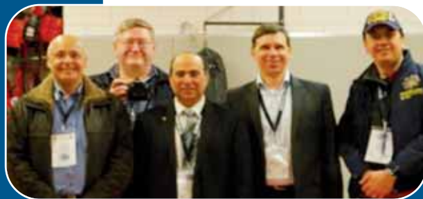
Membri della Commissione Professionale Internazionale