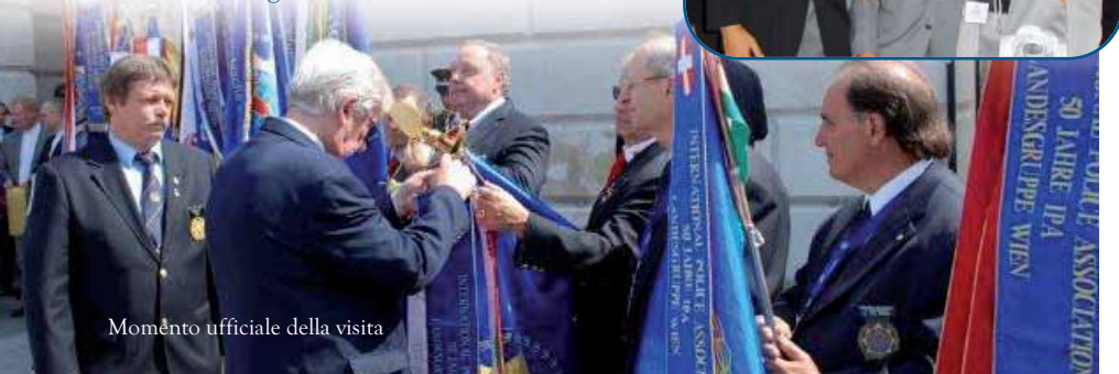
Momento ufficiale della visita