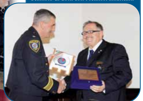
Scambio di doni con i relatori americani